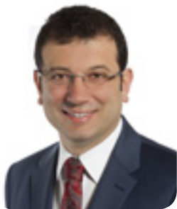
Ekrem İMAMOĞLU Belediye Başkanı

Gelin bu keyifli ayı hep birlikte sizlerin paylaşımlarıyla beraber yaşayalım. Tüm dileklerinizin gerçekleştiği bir ay olsun.